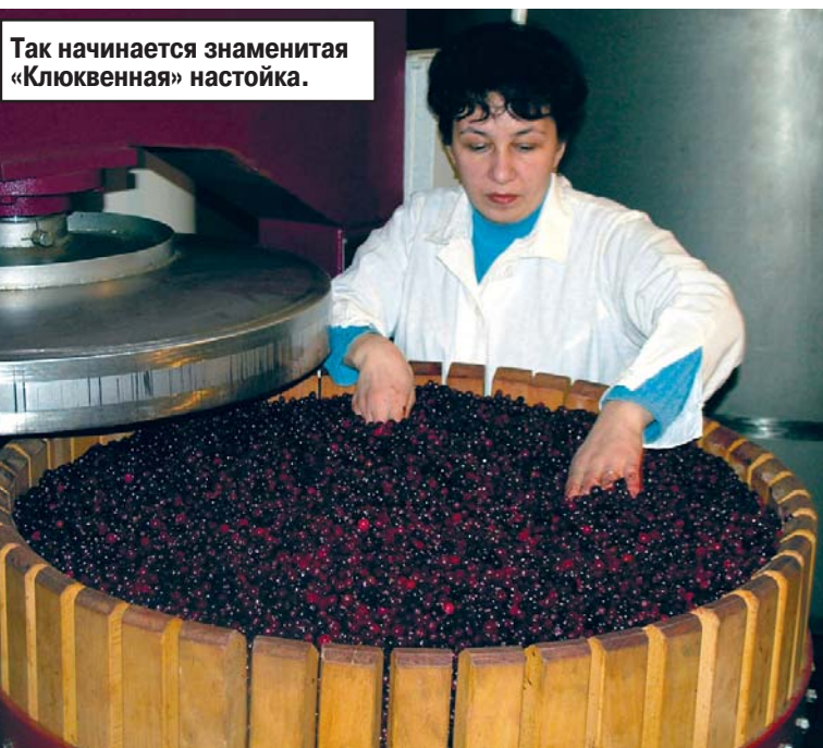
Так начинается знаменитая «Клюквенная» настойка.

Лицензия Б 068105 рег. №5 выдана МЧС РФ 10.04.2007г.